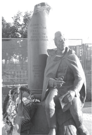
Памятник фронтовым корреспондентам в Москве

У отдельных подразделений были свои печатные издания. Например, в Военно-морском флоте центральным органом была газета «Красный флот». В сентябре 1941 г. вышла газета для личного состава Военно-воздушных сил «Сталинский сокол», а в октябре 1942 года газета «Красный сокол» – для личного состава авиации