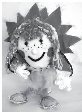
Одна из поделок

день перед нами стоят разносторонние задачи, связанные с развитием детей. Мы учим детей рисовать, шить, мастерить. Кроме этого создаем все возможные условия для развития их фантазии и творчества. Стараемся создать дружный сплочённый коллектив. — Дети какого возраста посещают ваш кружок? — У нас есть дошкольная группа, где дети