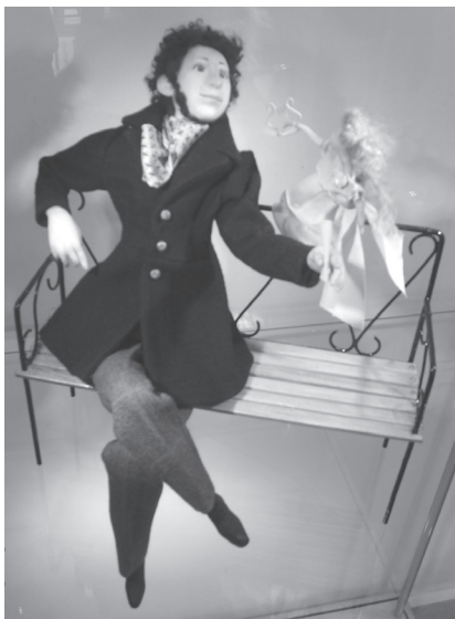
Кукла «Пушкин и Муза»