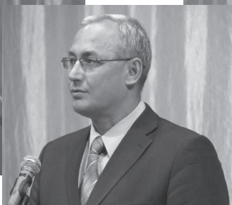
Министр образования и науки Челябинской области А. И. Кузнецов