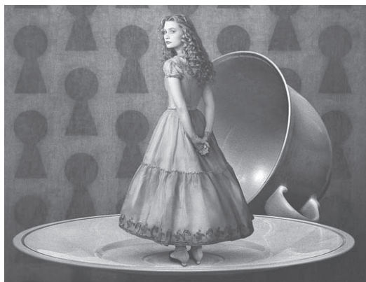
«Алиса в стране чудес» Тима Бёртона

Тим Бёртон известен сотрудничеством Джонни Деппом, Хеленой Бонем Картер, Джоанной Ламли, Кристофером Ли, Кристиной Риччи, Кэтрин О'Хара и другими. Но постоянную его безбашенную компанию составляют Джонни Депп и Хелена Бонем Картер. Они