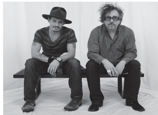
Джонни Депп и Тим Бёртон

В следующем номере: «Фантастика и триллер. Они вместе и порознь».