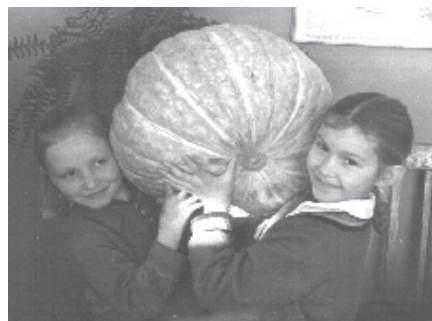
Школьники с тыквой

— Я и ещё учителя города. Дети готовили рефераты о птицах. Вот, например, в газете «Юный ленинец» 1962 года, которую