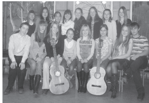
Счастливы «Вместе» уже 5 лет

В этом году клубу авторской песни «Вместе» ДПШ исполняется 5 лет. За это время коллектив выпустил немало талантливых ребят, идущих по жизни с музыкой в душе и с гитарой за спиной.