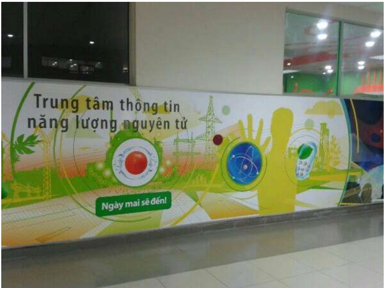
Центр в Ханое