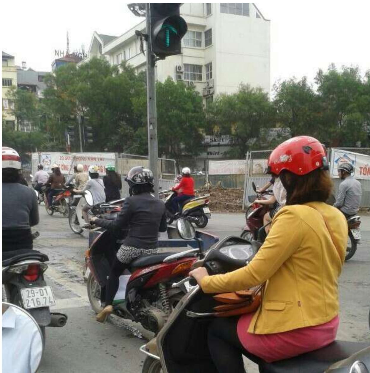
На Ханойских улицах.