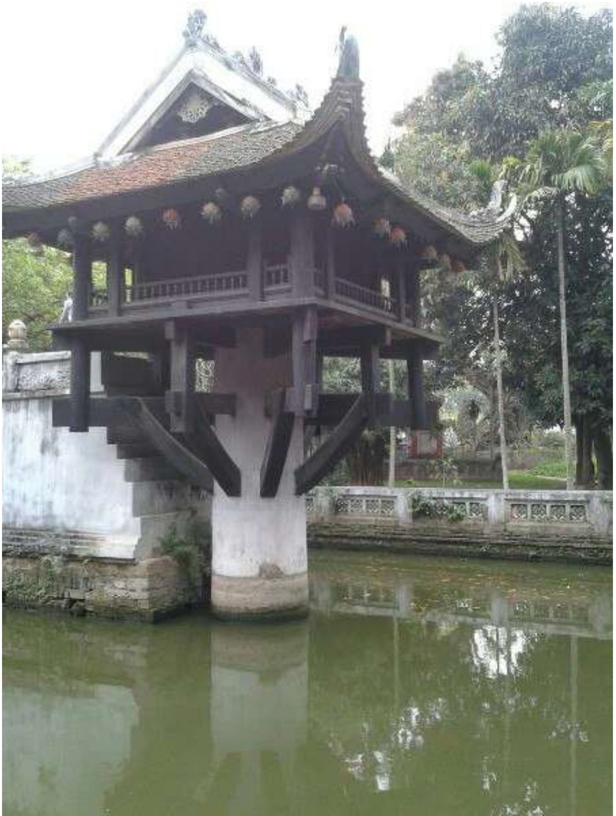
Пагода на одной ноге