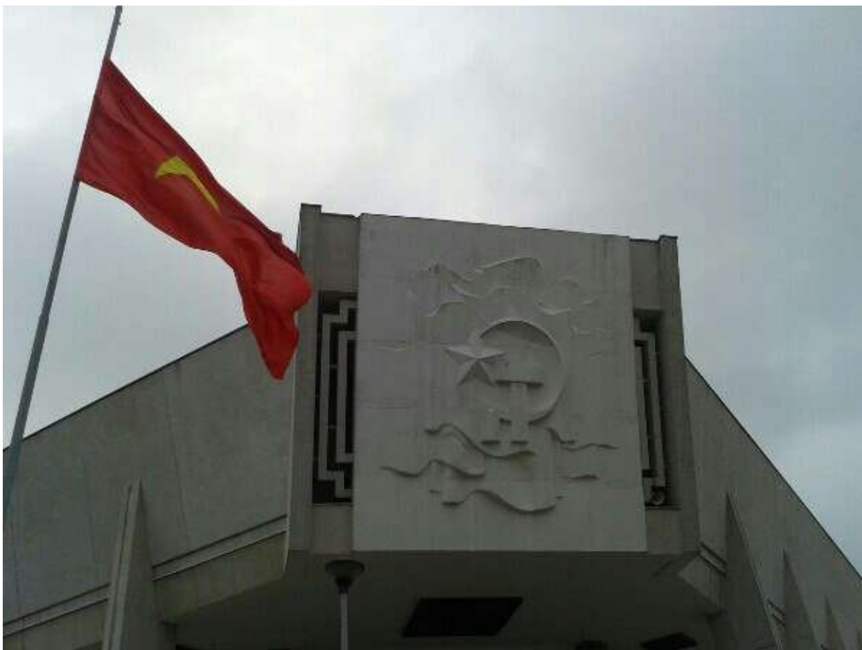
Музей Хо Ши Мина